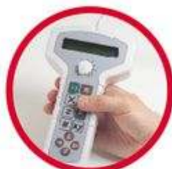
Control remoto para funções de gravação