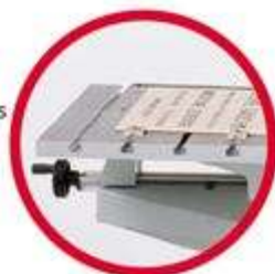
Opcional: Mesa de Ranhuras