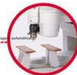
Standard: toma c/ centrage automática